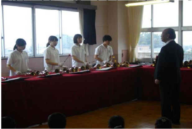
【白鷗大学生によるハンドベル演奏】(低学年)

今年は「食」のテーマを中心にたくさんの特長ある授業を開催しました。来校して下さった皆様、大変お世話になりました。児童たちも充実した秋の一日になったようです。