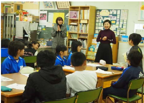
【「話す」プロに学ぶ】(高学年)