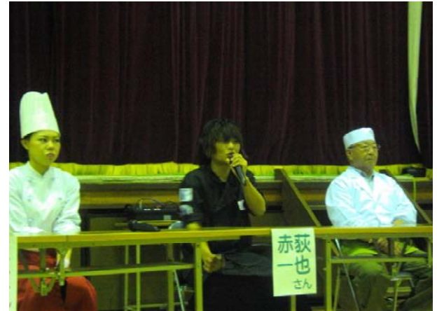
【「食」のプロに学ぶ】(全学年)