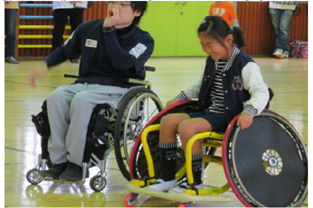
【車椅子バスケット】(中学年)